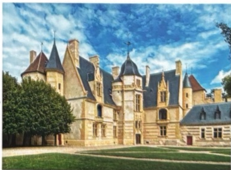
Logis Renaissance du Château d'Ainay-le-Vieil

Part of the private collection held at Château d'Ainay-le-Vieil, whose owners are the descendants of the Duchess of Tourzel, this historic treasure was last shown in public in 1955 for an exhibition, "Marie-Antoinette, Archduchess, Dauphine and Queen", at Château de Versailles. It can now be seen during guided tours of Château d'Ainay-le-Vieil*.