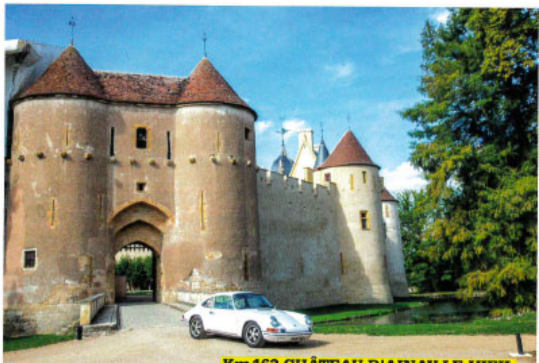
Km 163 CHÂTEAU D'AINAY-LE-VIEIL

à gauche) n'est jamais exactement la même, ce qui, pour le conducteur occasionnel, demande un temps d'adaptation. Seul petit défaut ici : la pédale de frein est trop haute par rapport à l'accélérateur, et le talon-pointe est impossible à faire en conduite normale.