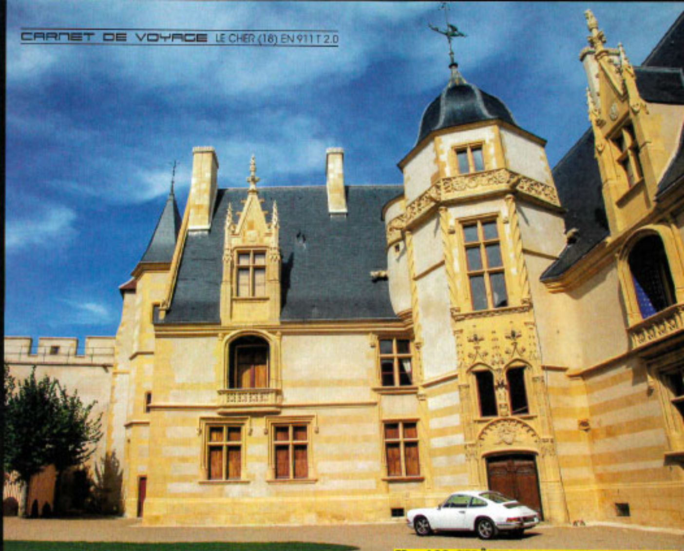
Km 163 CHÂTEAU D'AINAY-LE-VIEIL