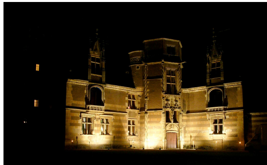
Façade du LogisGothique-Renaissance illuminée le soir