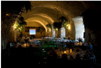
Salle des Archers