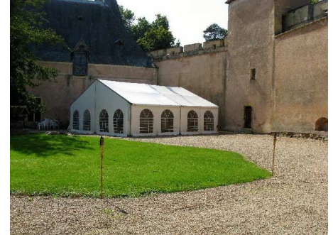
exemple d'installation de tente dans la cour intérieure