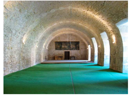
Salle des Archers