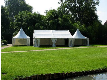
exemple d'installation de tente dans le parc pour un cocktail