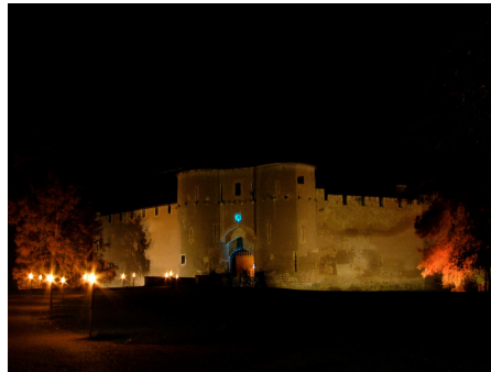
Château illuminé le soir