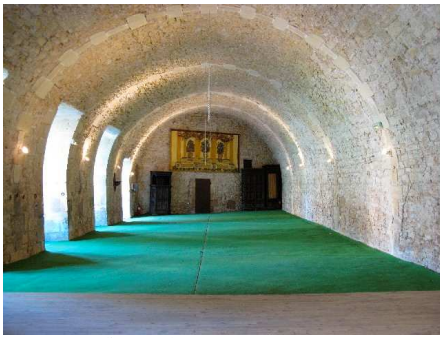
Salle des Archers