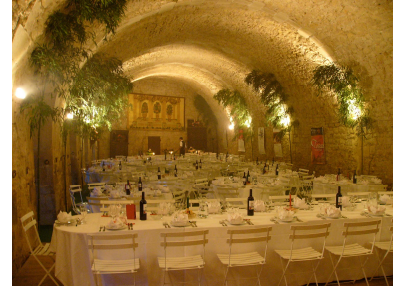
Salle des Archers

D Située en face de la façade du Logis Gothique-Renaissance, illuminée le soir, la Salle des Archers vous accueille dans un site chaleureux, sous sa voûte de pierre datant du XIII e siècle. E Salle de 200 m 2 environ, soit 25m X 8m au sol, recouvert d'une moquette, avec un plancher parquet de 5m X 8m servant de piste de danse. S Elle peut accueillir 160 personnes assises (jusqu'à 200 en utilisant la piste de danse) et 250 personnes debout pour des réunions, séminaires, conférences, concerts, réceptions, mariages, cocktails, etc... C R En raison de sa structure fiscale et juridique, la SCI est prestataire de lieux vides de tout mobilier : de la même manière, elle ne fournit aucun repas, nourriture ou boisson. L'utilisateur devra se mettre en rapport pour ces prestations avec des entreprises spécialisées. I P Lors d'une réception, la fermeture du château se fait à 5h du matin. Toute activité (y compris de prestataires) se prolongeant au delà de cette limite donnera lieu à une facturation supplémentaire de 120 euros par heure (toute heure commencée étant due). T O Le Parc du Château offre un emplacement éclairé mais non gardé qui peut accepter une dizaine de véhicules : au delà de ce nombre, les voitures devront se garer dans le village à l'extérieur de l'enceinte du Parc. N